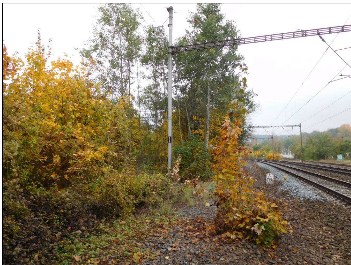
Obr. Situace v km 2,5