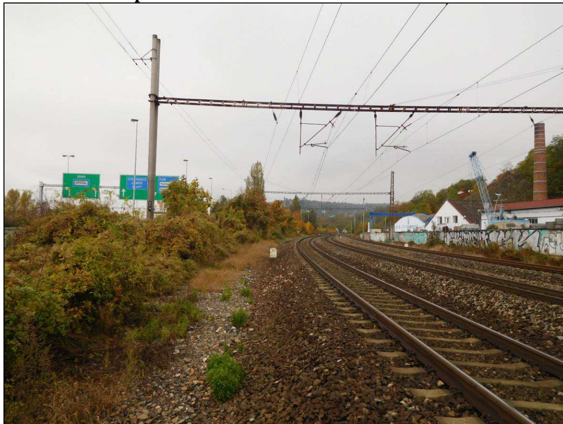
Obr. Situace v km 2,3